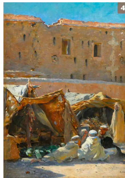
4. Le Marché de Brezina , au sud-ouest de Bou Saâda. Dinet savait parfaitement restituer la lumière crue et la chaleur de l'Algérie. 5. Illustration d'un épisode de la vie de Antar, héros semi-légitime d'avant l'Hégire. 6. L'un des tableaux les plus connus du peintre: Sur une terrasse un jour de fête à Bou Saâda .

Ses tableaux plaisent et il expose dans les plus grandes galeries parisiennes, chez Georges Petit, Allard, Durand-Ruel. Il participe à plusieurs expositions universelles en Europe dont celle de Paris en 1889 où il obtient une médaille d'argent. En 1893, avec les peintres Jean-Léon Gérôme et Benjamin Constant, il crée la Société des peintres orientalistes français. Chevalier de la légion d'honneur en 1896, il est fait officier en 1905. Quelques années plus tard, il participe à la fondation comme résidence